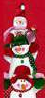
Foto con Babbo Natale