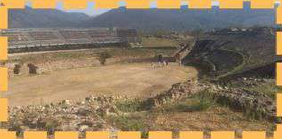
Anfiteatro romano I sec. a.C.