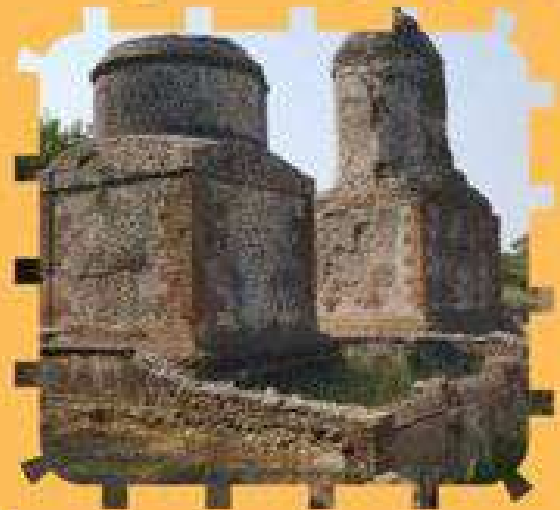
Mausolei funerari I sec a.C.- I sec d.C.

LUNGHEZZA CA. 7 KM DISLIVELLO 120 M - DURATA : 4.5 ORE - DIFFICOLTA' : T