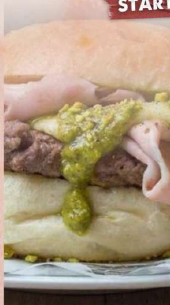
Panino con hamburger, mortadella, provola e pesto di pistacchio