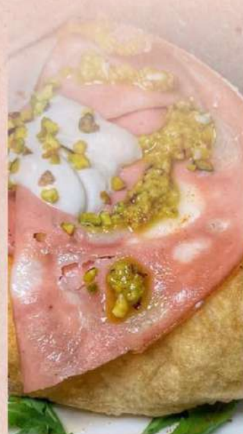
Pizzillo con mortadella, stracciatella e pesto di pistacchio