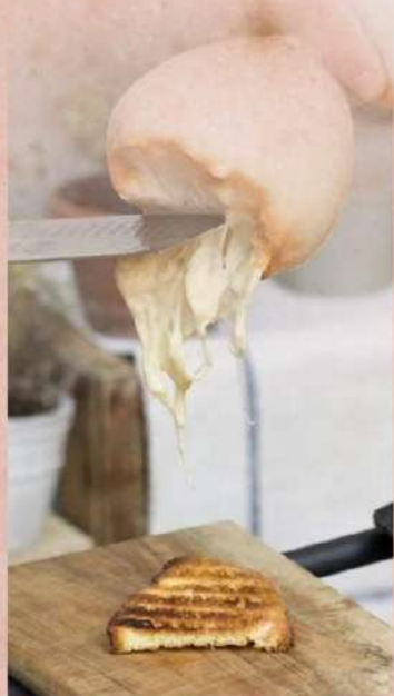
Bruschetta con caciocavallo impiccato e mortadella